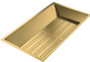
Perforierte Edelstahlwanne PVD Gold 8151 009 * nur in Kombination mit dem Zubehör 8644 101