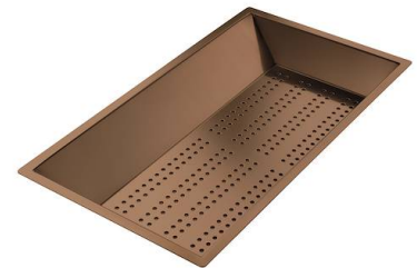
Perforierte Edelstahlwanne PVD Copper 8151 008 * nur in Kombination mit dem Zubehör 8644 101